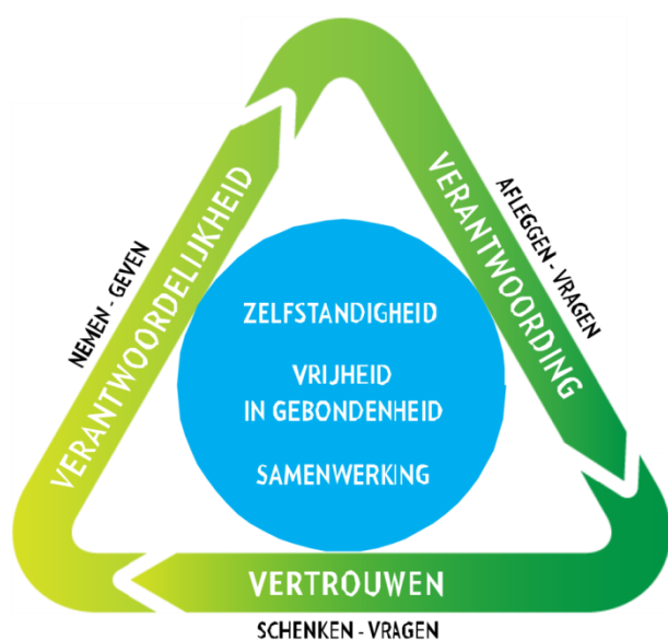
figuur 1. Daltondriehoek

De uitgangspunten van het daltononderwijs staan in de daltondriehoek, zie figuur 1.