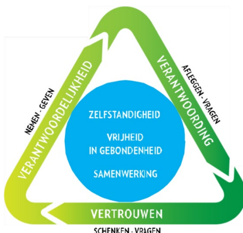
Figuur 1. Daltondriehoek

De uitgangspunten van het daltononderwijs staan in de daltondriehoek, zie figuur 1.